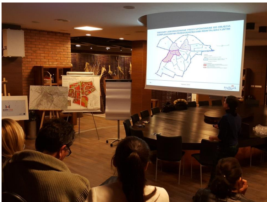
Fot.1. Zgromadzeni interesariusze mogli się zapoznać z dotychczasowymi wynikami prac w trakcie prezentacji multimedialnej.