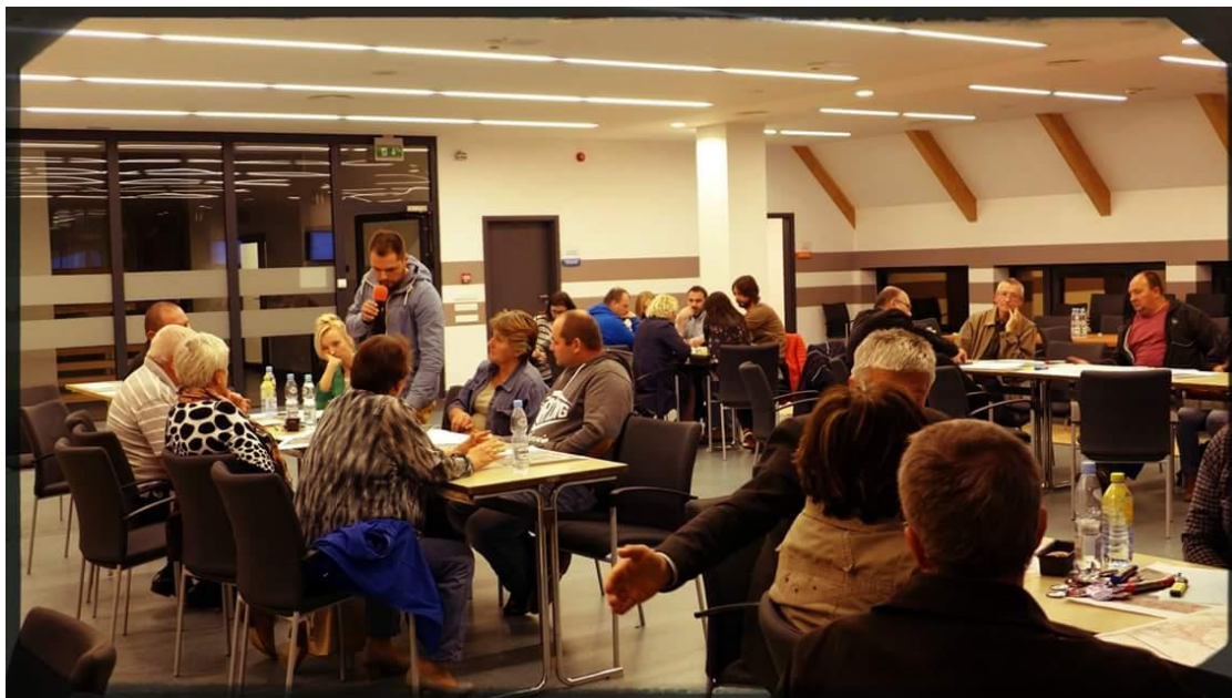
Zdjęcia z debaty, która odbyła się w Szkole Łacińskiej 1 października 2015 r.