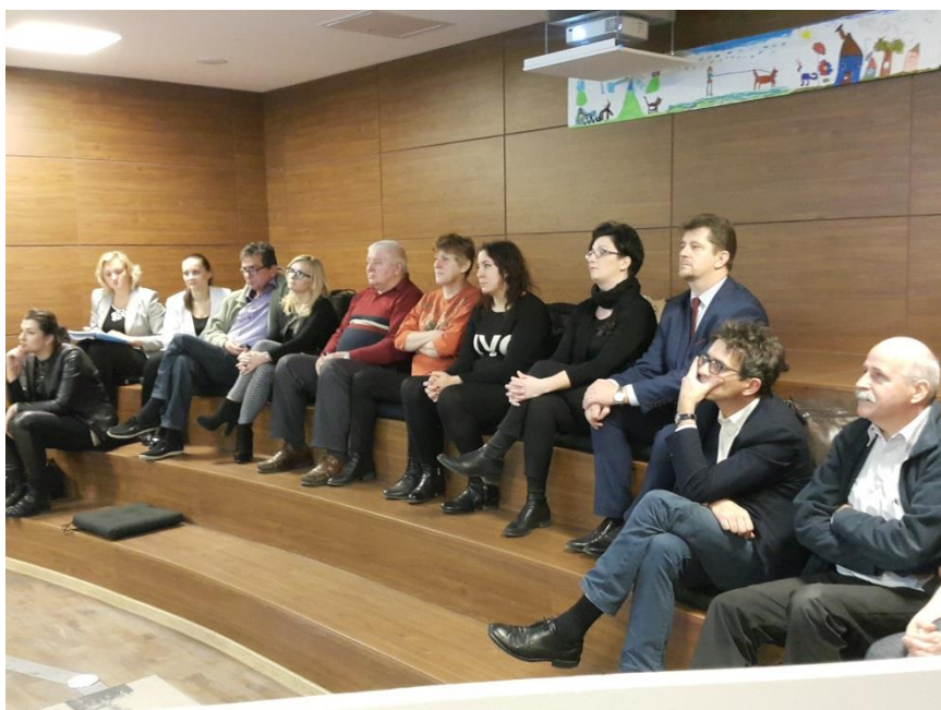
Fot.4. Interesariusze zgromadzeni w czasie spotkania w Szkole Łacińskiej - 2