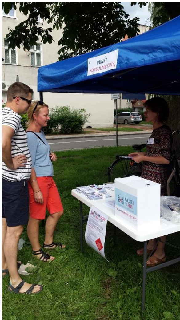
Punkt konsultacyjny na ul. Reymonta

Dokumentacja fotograficzna ze spotkania z interesariuszami rewitalizacji, które odbyły się w dniach 27-30 czerwca 2016 r.