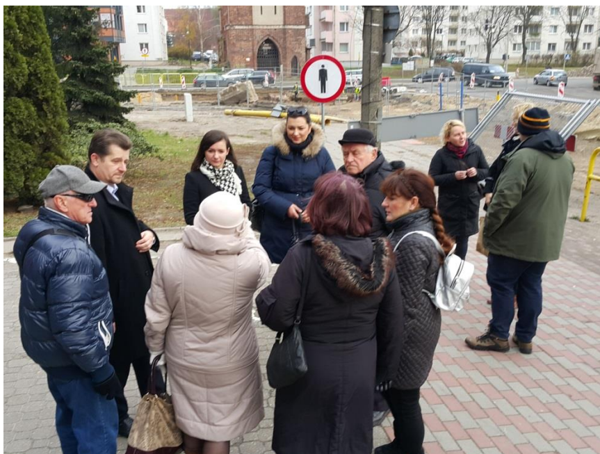
Fot. 5. Burmistrz Miasta Malborka wita zgromadzonych mieszkańców i zaprasza do wzięcia udziału w spacerze studyjnym.

Dokumentacja fotograficzna ze spaceru studyjnego po obszarze zdegradowanym przeznaczonym do rewitalizacji, które odbył się w dniu 19.11.2016 r i rozpoczął się o godz. 10.00 przed Urzędem Miejskim w Malborku.