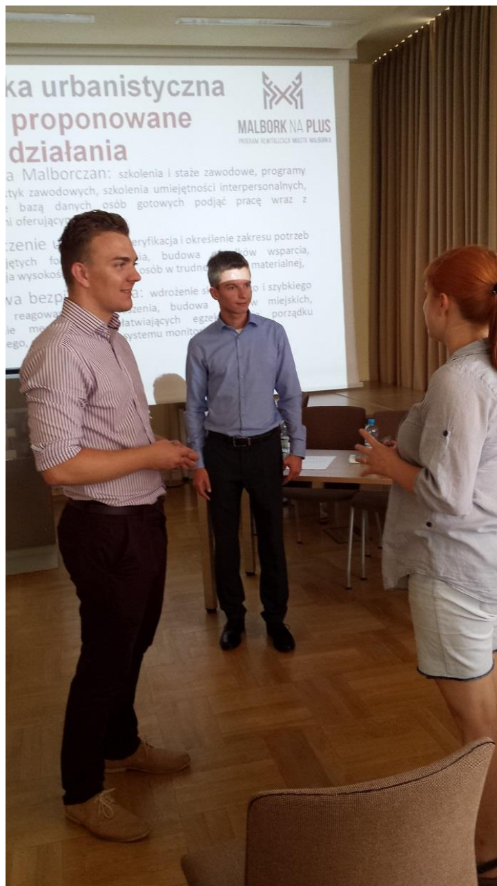
Debata w MWC na ul. Kościuszki