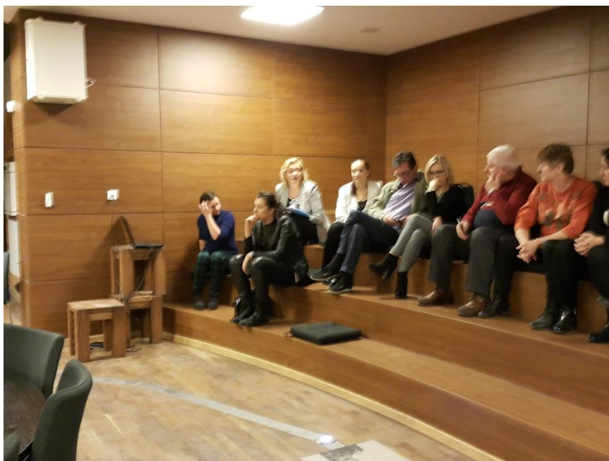
Fot.3. Interesariusze zgromadzeni w czasie spotkania w Szkole Łacińskiej - 1